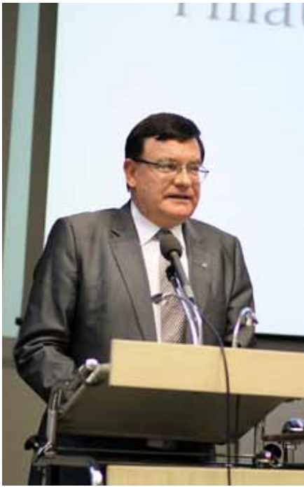
Szef służby cywilnej Sławomir Brodziński

- KSAP to nie tylko kształcenie stacjonarne, lecz także kształcenie ustawiczne - mówił minister. - Nie ukrywam, że dla mnie jest to bardzo ważny temat, jako że dotyczy bardzo szerokiego grona pracowników, urzędników służby cywil-