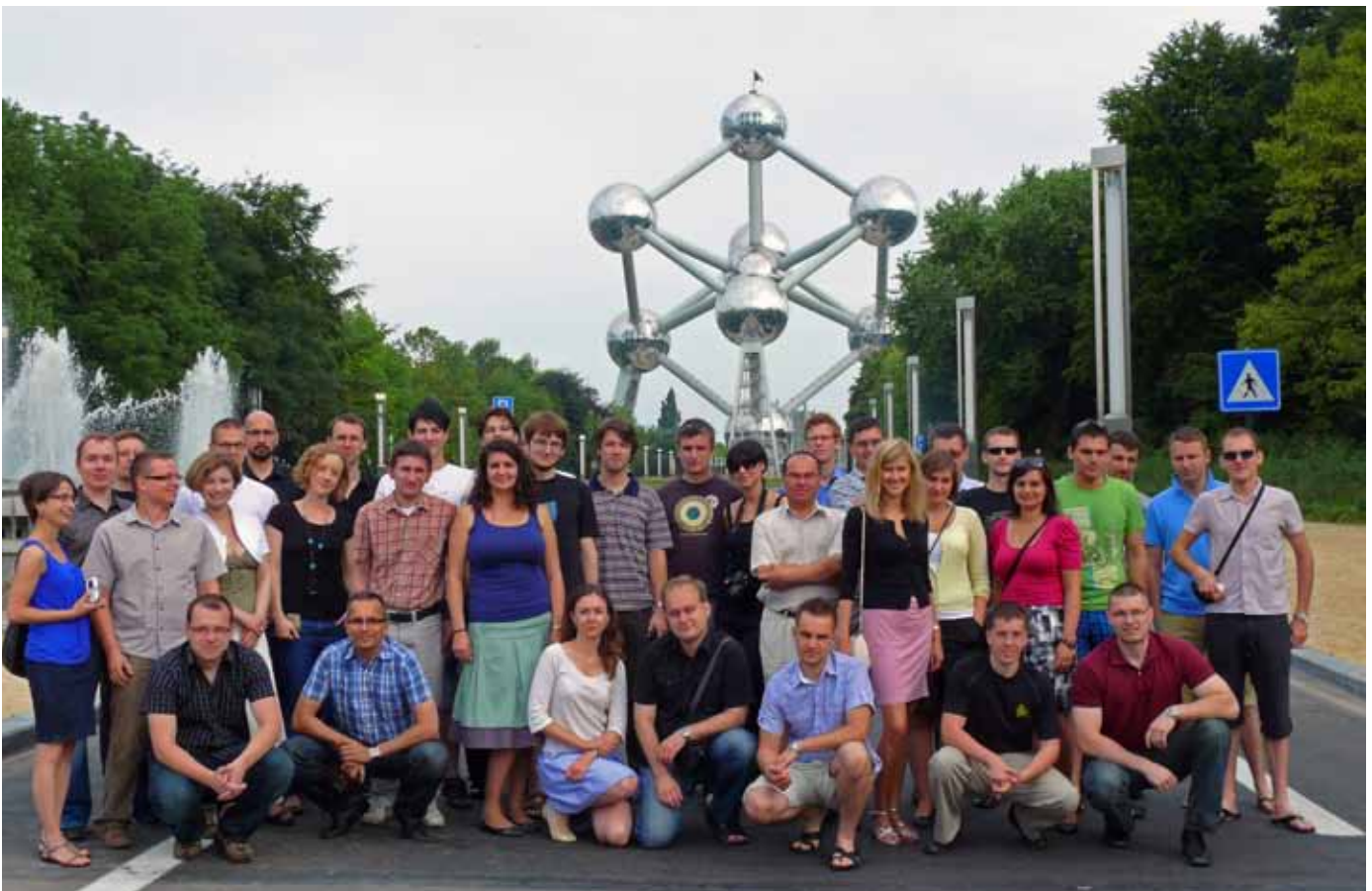
Słuchacze XX Promocji KSAP na tle Atomium w Brukseli

W instytucie badawczym Centre of European Policy Studies (CEPS) uczestnicy wysłuchali prezentacji na temat polityki regionalnej i polityki rynku pracy. Jorge Nunez Ferrer mówił na temat przyszłości europejskiej polityki regionalnej. Za jej dotychczasowe osiągnięcia uznał rozwój i poprawę stanu infrastruktury, zdolności zarządzania i odnotowany w większości wspieranych regionów wzrost realnego PKB w przeliczeniu na osobę. Kolejne spotkanie w CEEP odbyło się z Ilarią Maselli, która zaprezentowała problematykę udziału generacji wiekowej 50+ w rynku pracy. Omówiła też politykę wsparcia dla tej grupy wiekowej realizowaną w wybranych krajach UE.