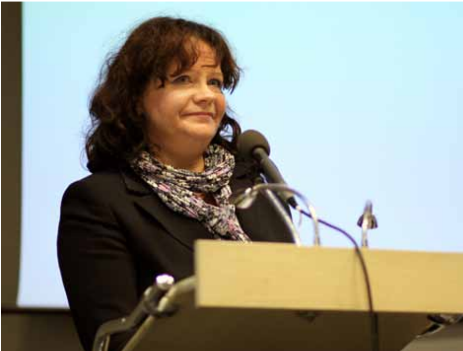
Minister nauki i szkolnictwa wyższego prof. Barbara Kudrycka